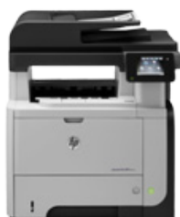
HP LJ Pro MFP M521dn (PN: A8P79A)