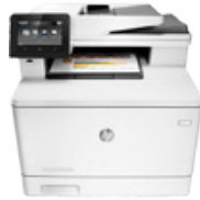
HP Color LaserJet Pro MFP M477fdn (PN: CF378A)