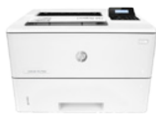
HP LaserJet Pro M501dn (PN: J8H61A)