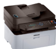
Samsung SL-M2070FW Laser MFP Printer (PN: SS296E)