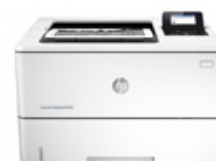
HP LaserJet Enterprise M506dn (PN: F2A69A)