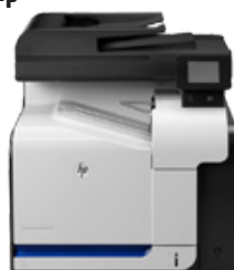
HP LJ Pro Color MFP M570dn (PN: CZ271A)