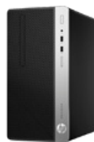
HP ProDesk 400 G5 MT (PN: 4CZ59EA)