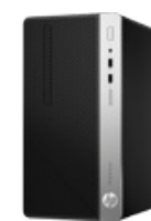
HP ProDesk 400 G5 MT (PN: 4CZ29EA)