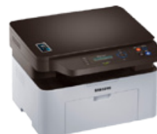
Samsung SL-M2070W Laser MFP Printer (PN: SS298D)