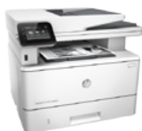
HP LaserJet Pro MFP M426fdn (PN: F6W14A)