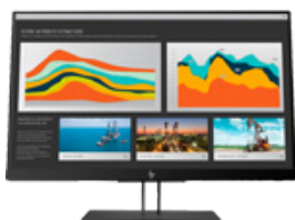
HP Z22n G2 (PN: 1JS05A4)