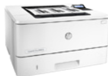
HP LaserJet Pro M402dne (PN: C5J91A)