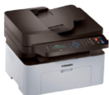
Samsung SL-M2070F Laser MFP Printer (PN: SS294C)