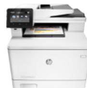
HP Color LaserJet Pro MFP M477fdw (PN: CF379A)