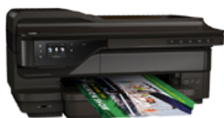
HP Office jet 7612 (PN: G1X85A)