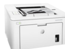
HP LaserJet Pro M203dw Prntr (PN: G3Q47A)