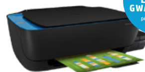
HP Ink Tank 319 (PN: Z6Z13A)