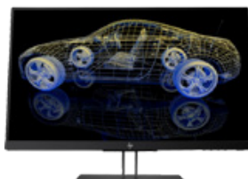
HP Z23n G2 (PN: 1JS06A4)